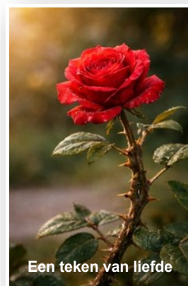
Een teken van liefde

Op een bepaald moment moest zij weer terug-zwemmen naar de kust. Doorzwemmen was zinloos en gevaarlijk. Ze zag haar zoontje voor haar ogen verder de zee op drijven. Ze moest omkeren, weg van haar zoontje. Tegen alle gevoel in moest ze terug. Wat moet dat een zware tocht zijn geweest: terug naar het strand dat nog leger leek dan anders.